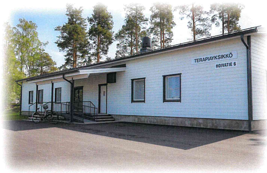
Terapiayksikkö rakennettiin leasingrahoituksella.