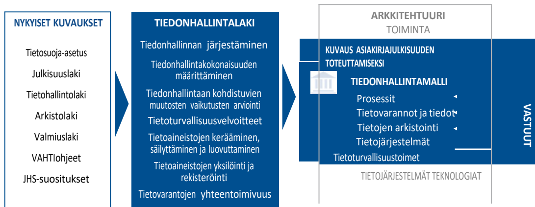
Kuva 1. Tiedonhallintalaki kokoaa kuvausvelvoitteita tiedonhallintamallin avulla.