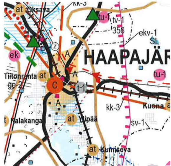
Kuva 2 Ote Pohjois-Pohjanmaan 1.-3. vaihemaakuntakaavan yhdistelmäkartasta.

Voimassa olevassa maakuntakaavassa suunnittelualue sijoittuu keskustatoimintojen alueelle (C). Suunnittelualue sijoittuu kahden yhdystien risteyskohtaan. Alue sijoittuu lisäksi maaseudun kehittämisen kohdealueelle (mk-6).