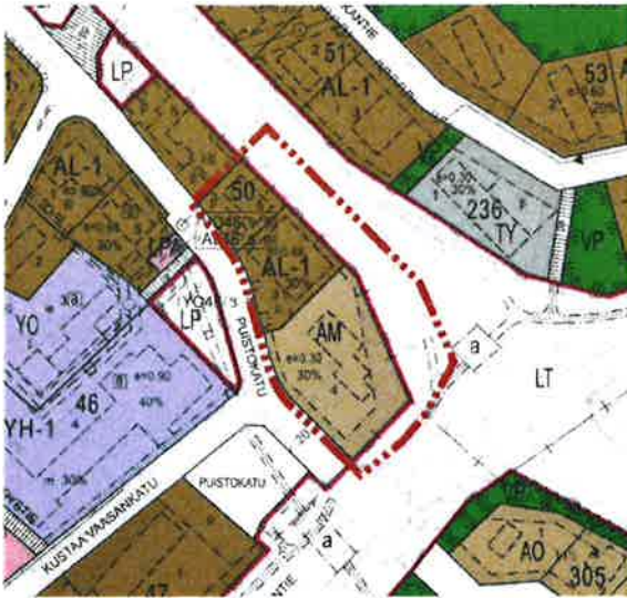
Kuva 4 Ote voimassa olevasta asemakaavayhdistelmästä.

Asemakaavassa suunnittelualue on osoitettu moottoriajoneuvojen huoltoasemien korttelialueeksi (AM) sekä asuin-, liike- ja toimistorakennusten korttelialueeksi (AL-1). Valtatiet on kaavamerkinnällä osoitettu kauttakulku- ja yhdystiealueeksi näkemäalueineen (LT).